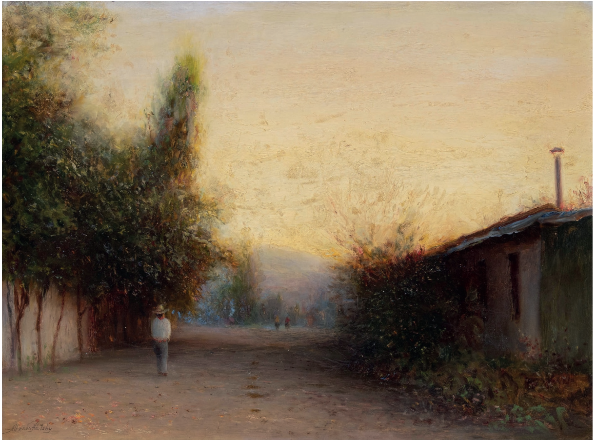
Alfredo Helsby Calle de pueblo Óleo sobre tela 49 x 64 cm