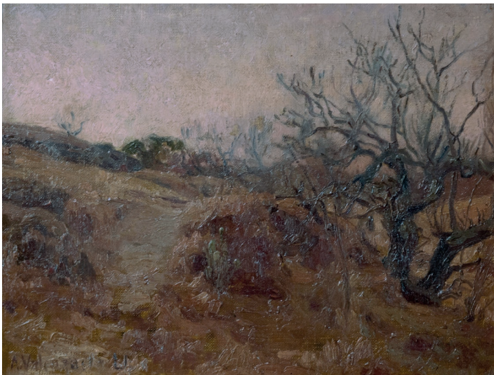
Alberto Valenzuela Llanos Crepúsculo en verano Óleo sobre madera 26 x 34 cm