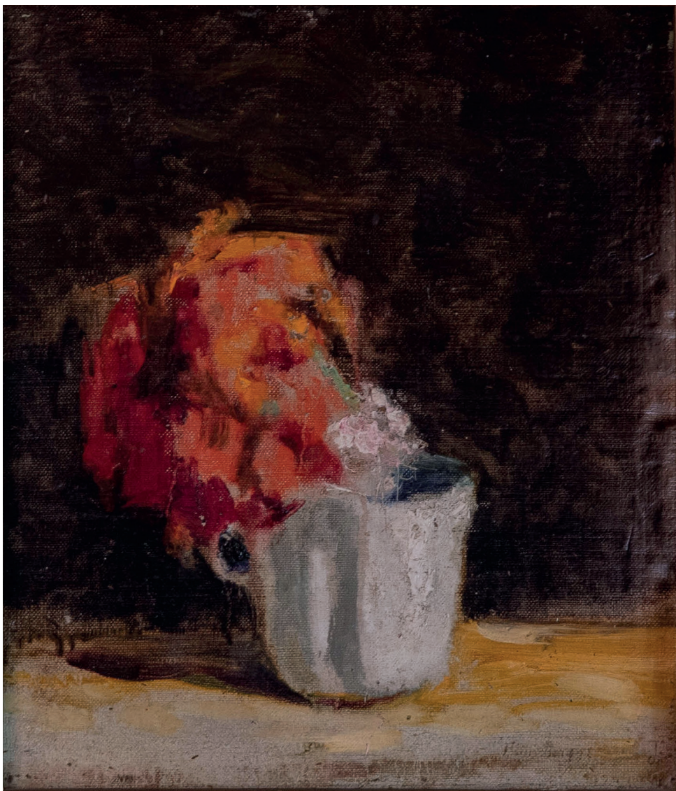
Pablo Burchard. Taza con cardenal. Óleo sobre madera, 36 x 30 cm