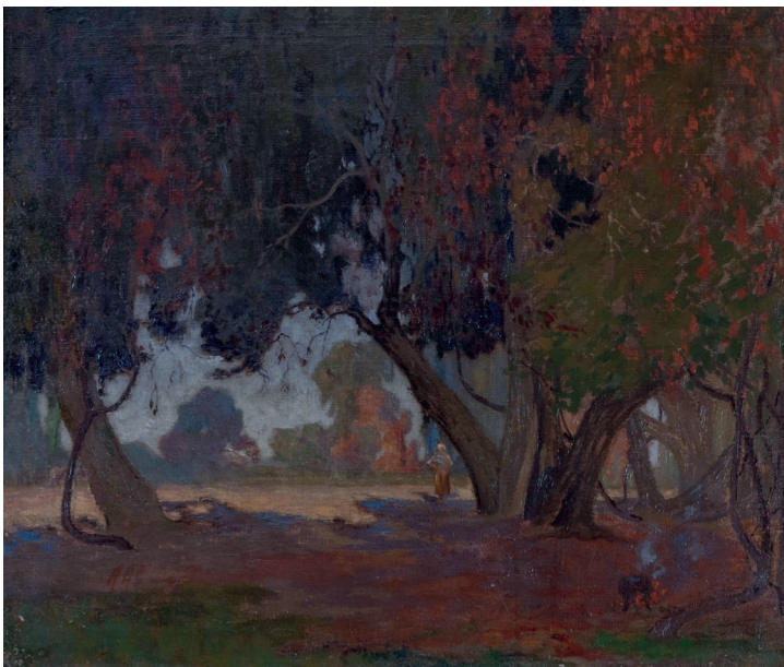
Agustín Abarca Peumos Óleo sobre tela 58 x 69 cm